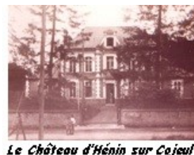
Le Château d'Hénin sur Cojeul