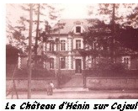
Le Château d'Henin sur Cojeul