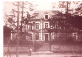
Le Château d'Hénin sur Cojeul