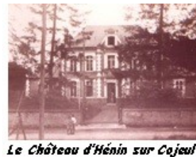
Le Château d'Hénin sur Cojeul