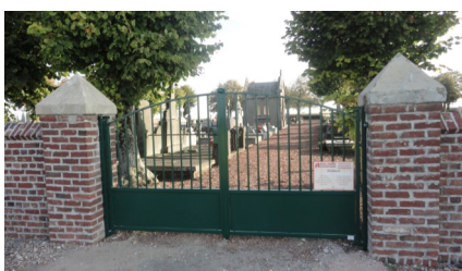
Porte posée par l'entreprise Artois porte automatiques